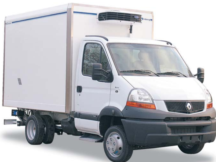
Option groupe frigorifique