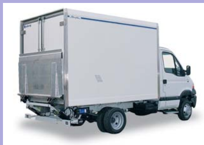
Hayon élévateur en option.