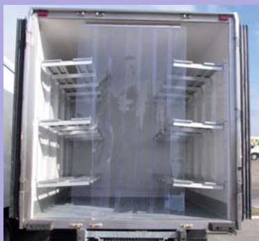
Option étagères relevables et rideau ant-déperdition