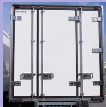
Deux portes arrière ouverture 2/3 1/3