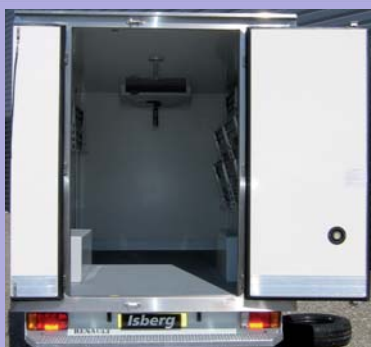
Etagères en option Plancher anti-dérapant