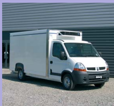
Groupe frigorifique en option.