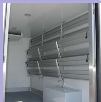
Etagères inclinées réglables relevables en option