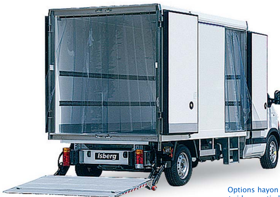
Options hayon élévateur et rideau anti-déperdition