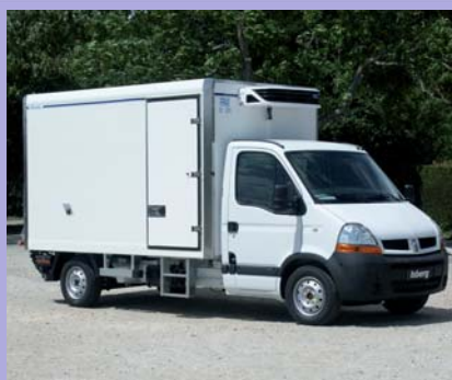
Groupe frigorifique en option.