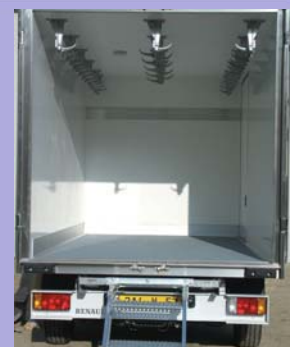
Rail à viande avec crochets en option