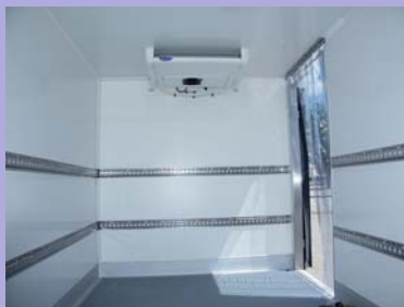
Option rideau anti-déperdition à la porte latérale et options rails d'arrimage