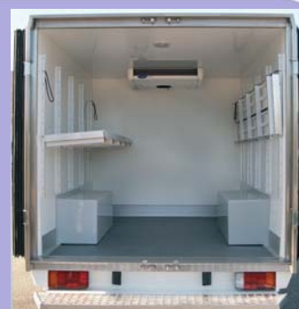
Etagères en option. Marchepied pare-chocs arrière fixe.