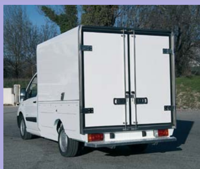
Ouverture à l'aide de 2 portes arrière.