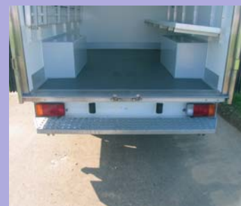
Marchepied pare-chocs arrière fixe. Caissons de passage de roues.