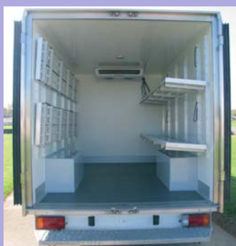
Etagères en option Plancher anti-dérapant