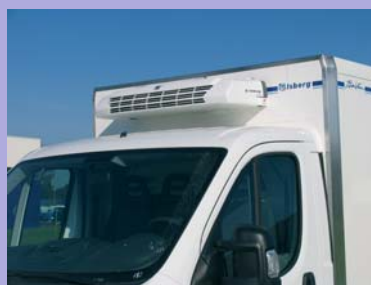
Groupe frigorifique en option.