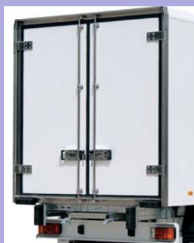
2 portes arrière ouverture totale.