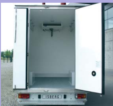
2 portes arrière ouverture 2/3 1/3