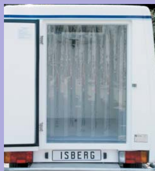
Option rideau anti-déperdition