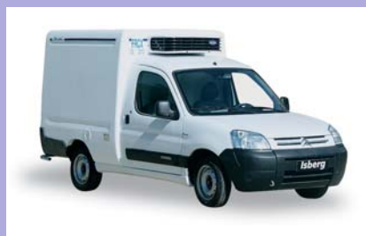
Groupe frigorifique en option