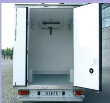
2 portes arrière ouverture 2/3 1/3