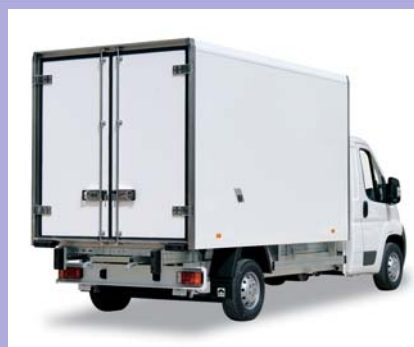
2 portes arrière ouverture totale.