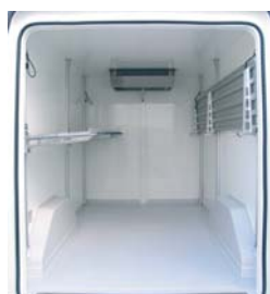
Un niveau d'étagères relevables de chaque côté