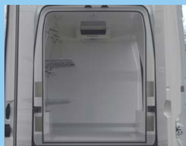
Nombreuses options personnalisées.