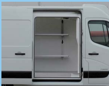
Accessibilité maximum avec porte latérale coulissante.