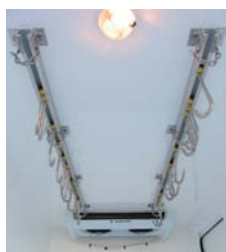
Barre à viande avec crochets