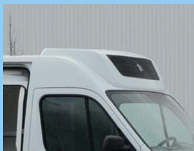
Groupe frigorifique en capucine (avec option carénage)