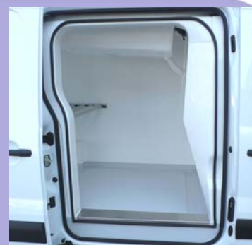
Contre-porte isotherme fixée sur la porte latérale d'origine