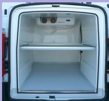
Plancher antidérapant avec caissons de passages de roues