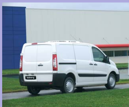
Groupe frigorifique électrique extra plat en option