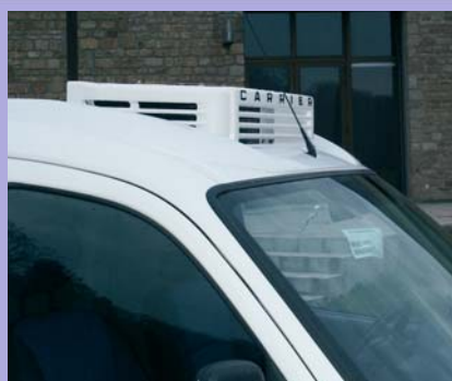
Groupe frigorifique en option