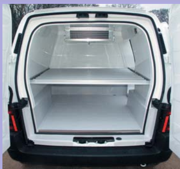
Option plancher intermédiaire total ou partiel