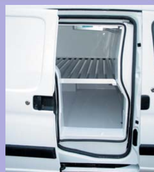
Isolation des ouvrants d'origine par des contre-portes isothermes