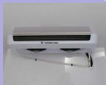
Groupe frigorifique en option