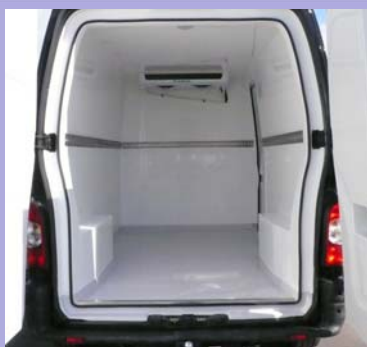
Cellule isotherme. Rail d'arrimage en option.