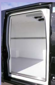
Contre-porte isotherme fixée sur la porte latérale d'origine.