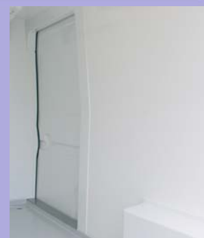
Contreporte isotherme sur la porte latérale d'origine