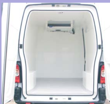
Plancher anti-dérapant avec caissons de passage de roues