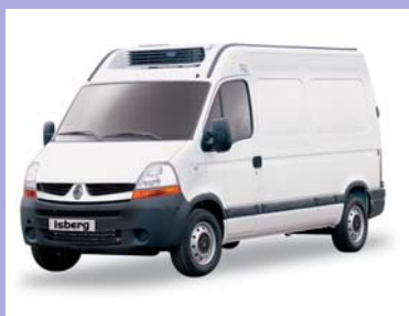
Véhicule frigorigère Groupe frigorifique en option