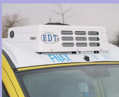
Groupe frigorifique en option