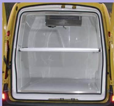
Option plancher intermédiaire total ou partiel