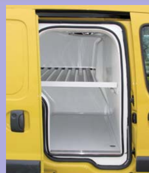
Porte latérale coulissante droite isolée en option