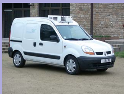
Véhicule présenté avec groupe frigorifique en option