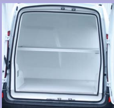
Option plancher intermédiaire total ou partiel