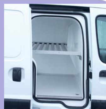
Porte latérale coulissante droite isolée en option