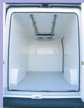
Barre à viande inox en option