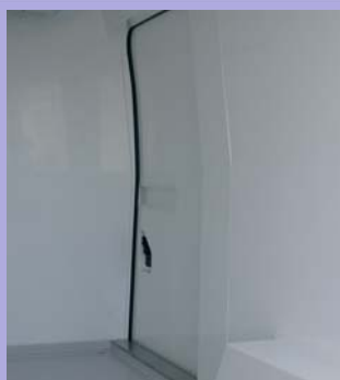
Porte latérale coulissante isolée en option