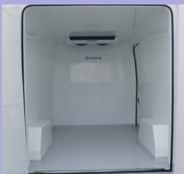
Plancher anti-dérapant avec caissons de passage de roues