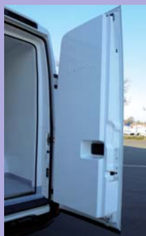
Portes arrière isolées par des contre-portes isothermes