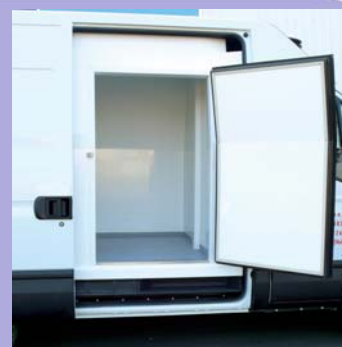
Porte latérale isolée par une contre-porte isotherme battante.