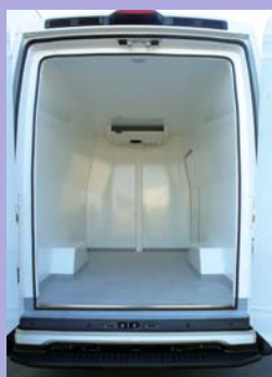
Plancher anti-dérapant avec caissons de passage de roues