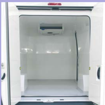
Plancher anti-dérapant avec caissons de passage de roues