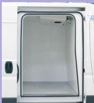
Porte latérale coulissante isolée en option