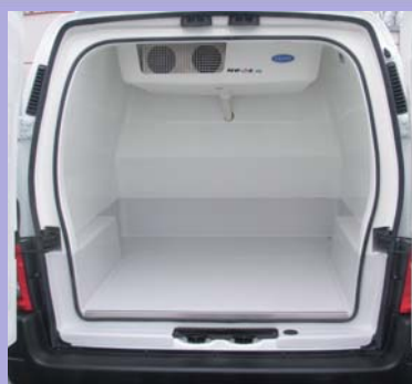
Plancher antidérapant avec caissons de passage de roues