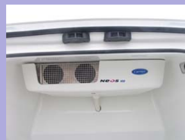
Groupe frigorifique monobloc