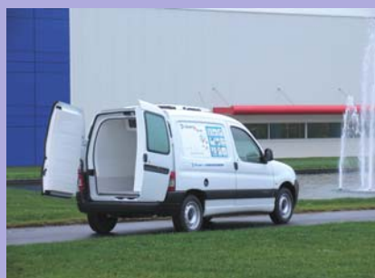
Groupe frigorifique ÉLECTRIQUE EXTRA PLAT en option