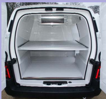
Option plancher intermédiaire total ou partiel