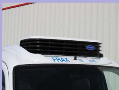
Groupe frigorifique en option