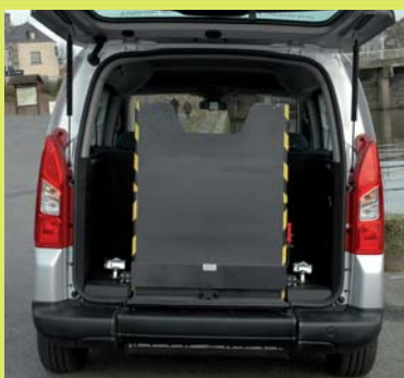
Rampe légère antidérapante, assistée, relevable manuellement en 1 partie.