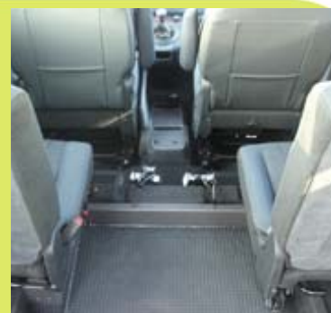
2 enrouleurs électriques à l'avant du décaissement.