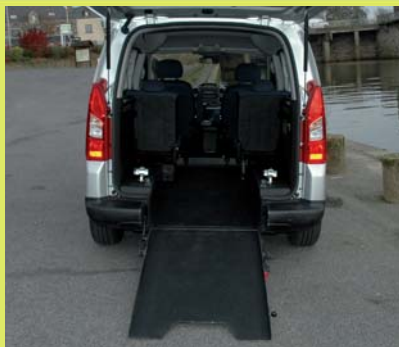
Large décaissement de la partie arrière recouvert d'antidérapant et insonorisé.