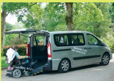
Version Haccess Plus : rampe manuelle courte et abaissement automatique du véhicule