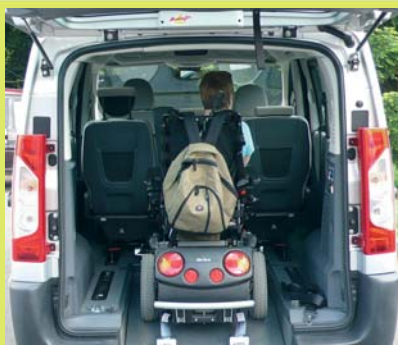
Véhicule spacieux faites de la route un espace de vie