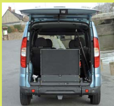
Rampe légère antidérapante, assistée, relevable manuellement en 2 parties.