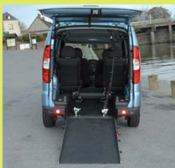
Large décaissement de la partie arrière garni d'un tapis antidérapant.